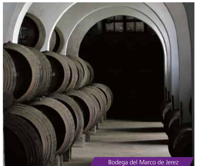
Bodega del Marco de Jerez

¿Pero qué son exactamente los vinos generosos ? También denominados fortificados o encabezados , son aquellos en los que en su proceso de elaboración se ha añadido alcohol vínico. En este tipo de elaboraciones contamos con dos grandes familias: los que se someten a una crianza biológica y aquellos que se elaboran con una crianza oxidativa. La primera está relacionada con el velo de flor, una capa de levaduras que se generan de manera natural sobre el vino en la bota, nombre con el que se denomina en Jerez a las barricas de 500 litros.