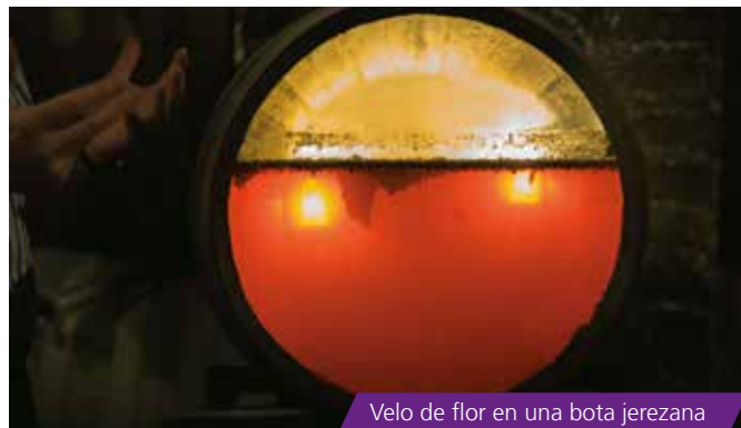
Velo de flor en una bota jerezana

Precisamente con la uva pedro ximénez se elabora uno de los vinos dulces españoles más afamados tanto en el mercado interior como en la exportación. Este vino, que se llama igual que la uva con la que se elabora y que tiene tanto en el Marco de Jerez como en la DOP Montilla-Moriles sus orígenes más claros, es fruto de un método de vinificación único: se elabora con uvas pedro ximénez que han sido previamente "asoleadas", es decir, se colocan los racimos al sol para aumentar su riqueza en azúcares.